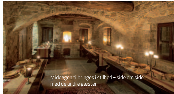
Middagen tilbringes i stilhed – side om side med de andre gæster.

Marcello ønsker med Eremito at lave et moderne kloster for os almindelige syndere – et sted, hvor vi kan disconnecte for at blive bedre til at connecte med det vigtige i livet.