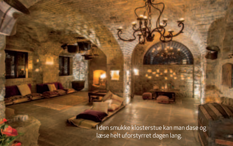
I den smukke klosterstue kan man dase og læse helt uforstyrret dagen lang.

"Jeg klæder om til noget blødt og behageligt og sætter mig ned i klostrets hjerte og skriver. Med grøn te, gregoriansk munkesang og en sær følelse af afklarethed og lethed"