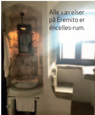
Alle værelser på Eremito er éncelles-rum.

Opholdet på Eremito er med alle måltider og transport fra den lokale togstation. Jeg fløj til Rom og tog herefter toget to timer til Fabro-Ficulle. Det koster 1.200-1.500 kr. pr. døgn pr. person. Læs mere om EREMITO på Eremito.com